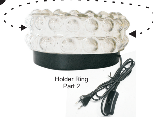
Holder Ring Part 2