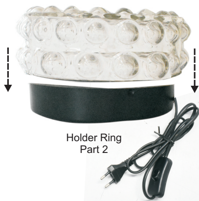
Holder Ring Part 2